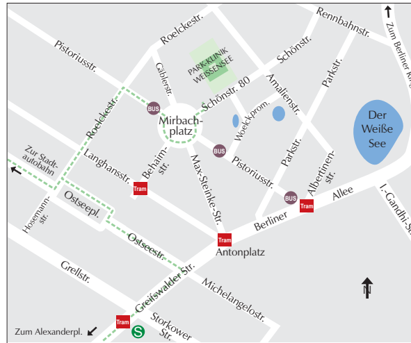
Lage: 4,5 km nordöstlich vom Alexanderplatz (Mitte) - - - - - Anfahrt mit dem PKW über Stadtautobahn bzw. aus Stadtmitte

Grundsätzlich gilt: treten neue oder für Sie bedrohliche Symptome auf, suchen Sie bitte Ihren Arzt oder die Erste-Hilfe-Stelle auf!