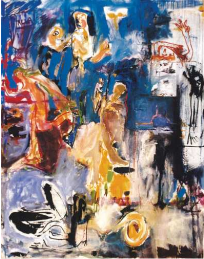
summer in the city oil on canvas 180x145 cm