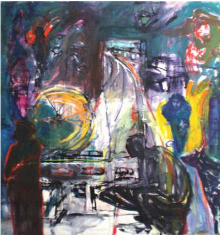
sunwheel oil on canvas 170x155 cm