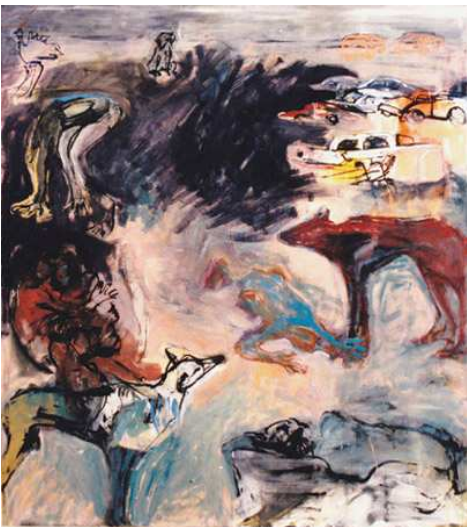
foreshadow oil on canvas 190x170 cm