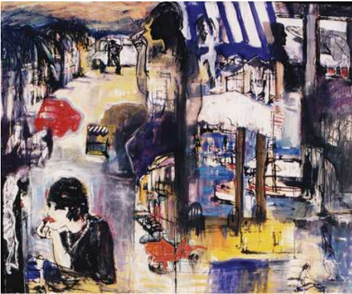
dressed to kill, oil on canvas 140x175 cm

KUNST in der PARK-KLINIK WEISSENSEE Schönstr. 80, 13086 Berlin, www.park-klinik.com