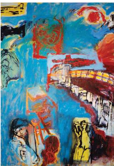
berlin blues oil on canvas 180x130 cm