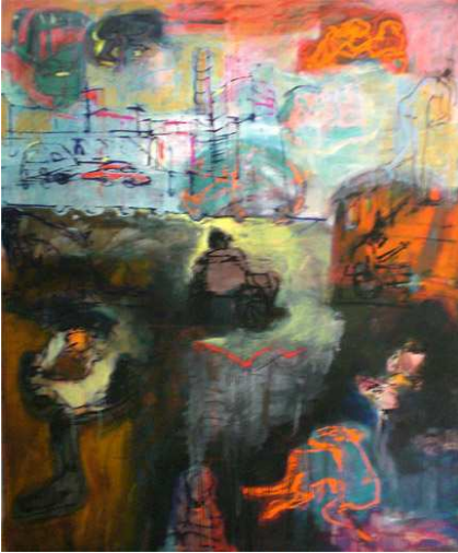
without title oil on canvas 185x145 cm