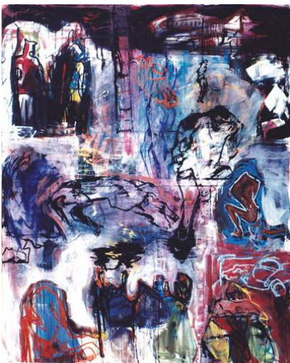
through the ciclamon haze oil on canvas 185x150 cm