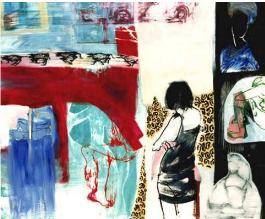
skintight oil on canvas 160x195 cm