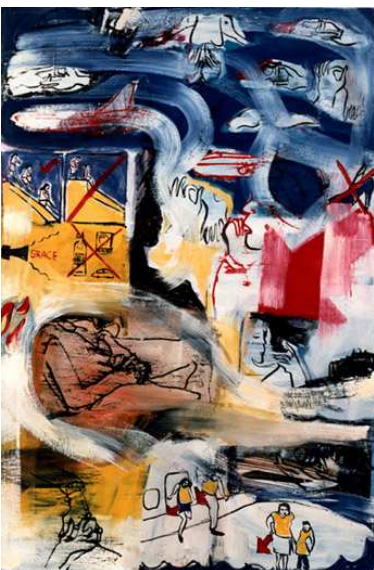
fear of falling oil on canvas 195x130 cm