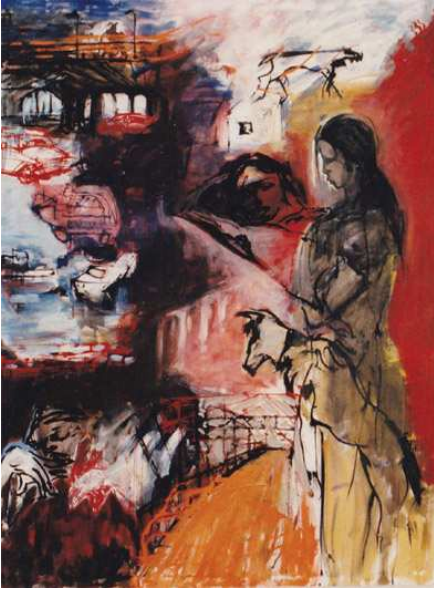
without title oil on canvas 190x160 cm