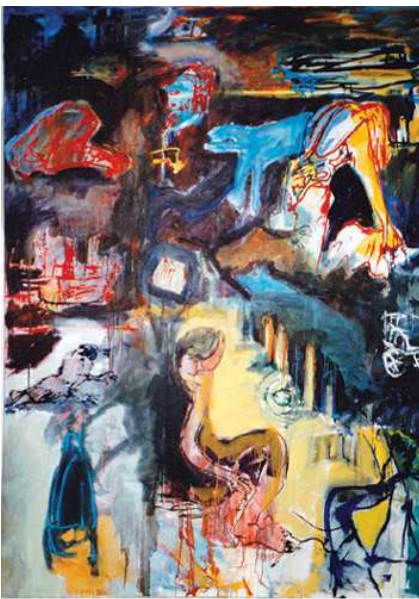
twilight oil on canvas 195x145 cm